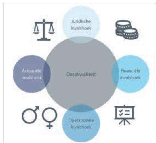
Figuur 2: holistische blik op datakwaliteit