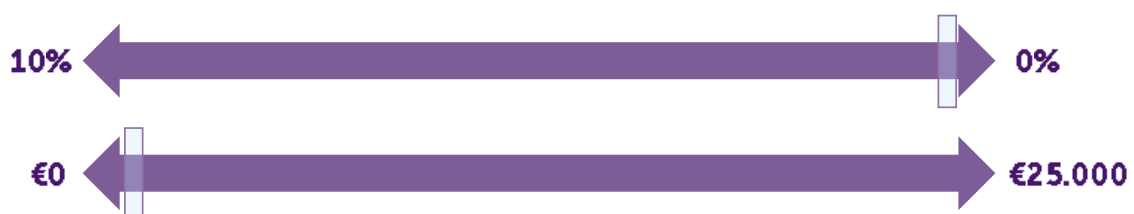
Figuur 3: Twee voorbeelden van het presenteren van keuzemogelijkheden ten aanzien van de hoogte van het bedrag ineens.

Bij het vormgeven van de keuzeomgeving maakt het uit hoe de deelnemer gevraagd wordt welk bedrag hij ineens wil opnemen: begin je met het hoogste of het laagste percentage? Heb je het over percentages of absolute bedragen? De volgende voorbeelden zullen vermoedelijk leiden tot andere keuzes: